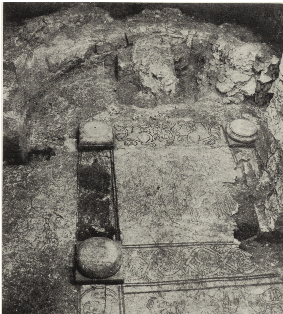
Ryc. 2. Wiślica, płyta posadzkowa w krypcie kościoła romańskiego z dekoracją figuralno-ornamentalną części środkowej, XII w.

niez była użyta do budowy fundamentów części dobudowanej. Wokół tych sakralnych obiektów został zbadany cmentarz, na którym pod jedną z płyt, również ze sztucznego kamienia, przy szkielecie znaleziono monetkę Bolesława Śmiałego sprzed koronacji. Można by więc sądzić, że dobudowanie kaplicy nastąpiło w drugiej połowie wieku XI. Również na wiek XI datuje się wzniesienie na wyspie w pobliżu miasta