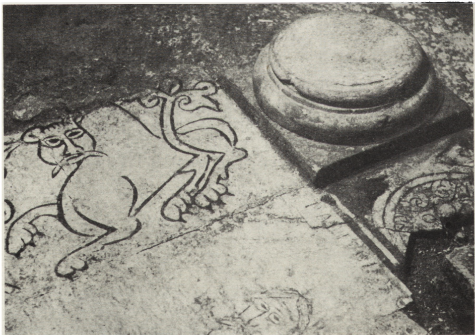
Ryc. 4. Wiślica, krypta kościoła romańskiego, fragment płyty posadzkowej z bazą kolumny, XII w. (odkryte 1960 r.)