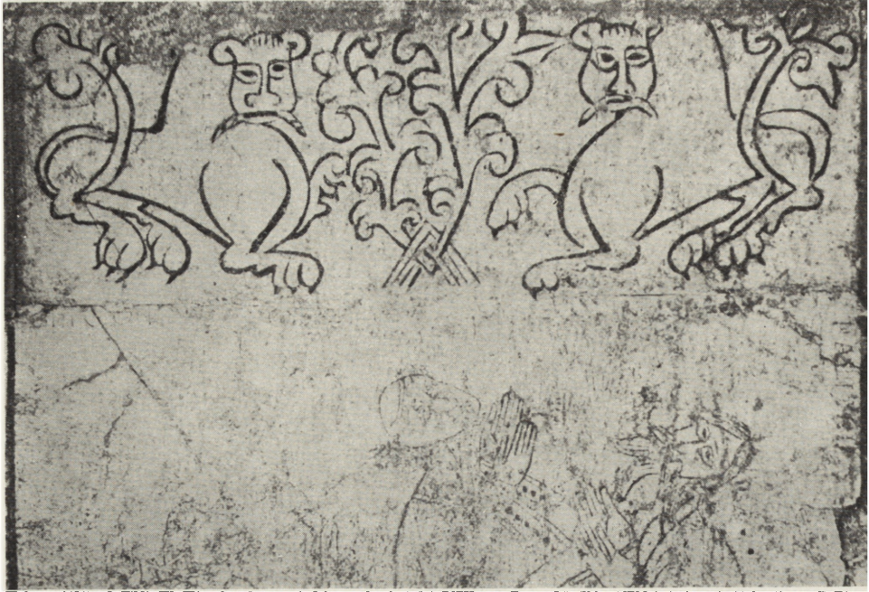
Ryc. 3. Wiślica, krypta kościoła romańskiego, fragment dekoracji płyty posadzkowej przed ołtarzem, XII w. (odkryte 1960 r.)